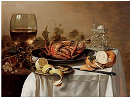
Πίτερ Κλες (1597–1660), Νεκρή φύση .