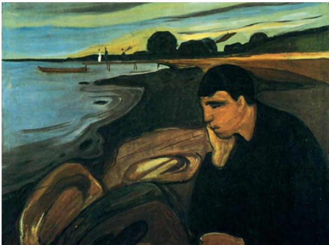
Έντβαρντ Μουνκ, Μελαγχολία , 1891.