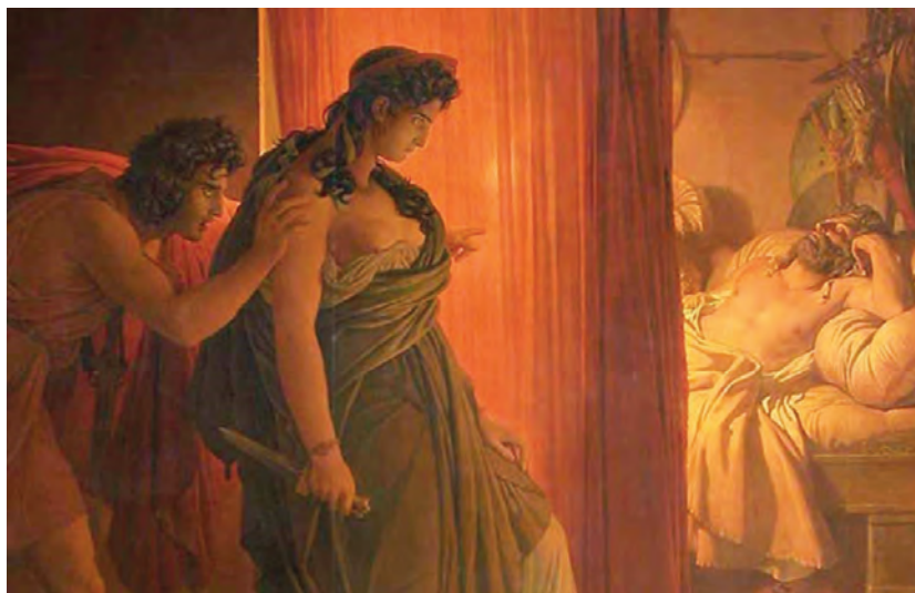
Πιερ-Ναρσίς Γκερέν, Κλυταιμνήστρα και Αγαμέμνων , περ. 1822.