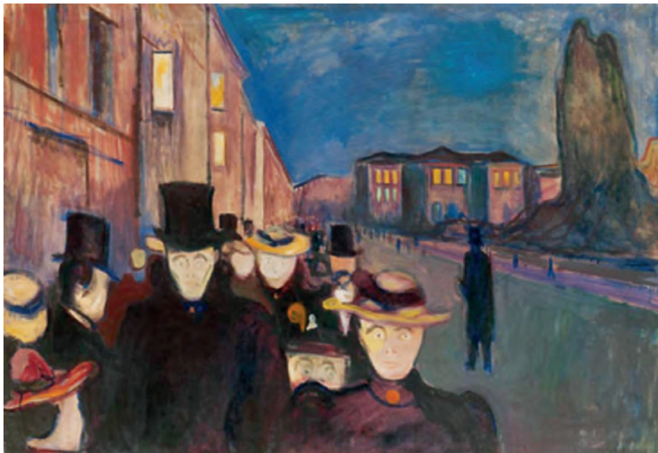
Έντβαρντ Μουνκ, Βράδυ στην οδό Καρλ Γιόχαν , 1892.