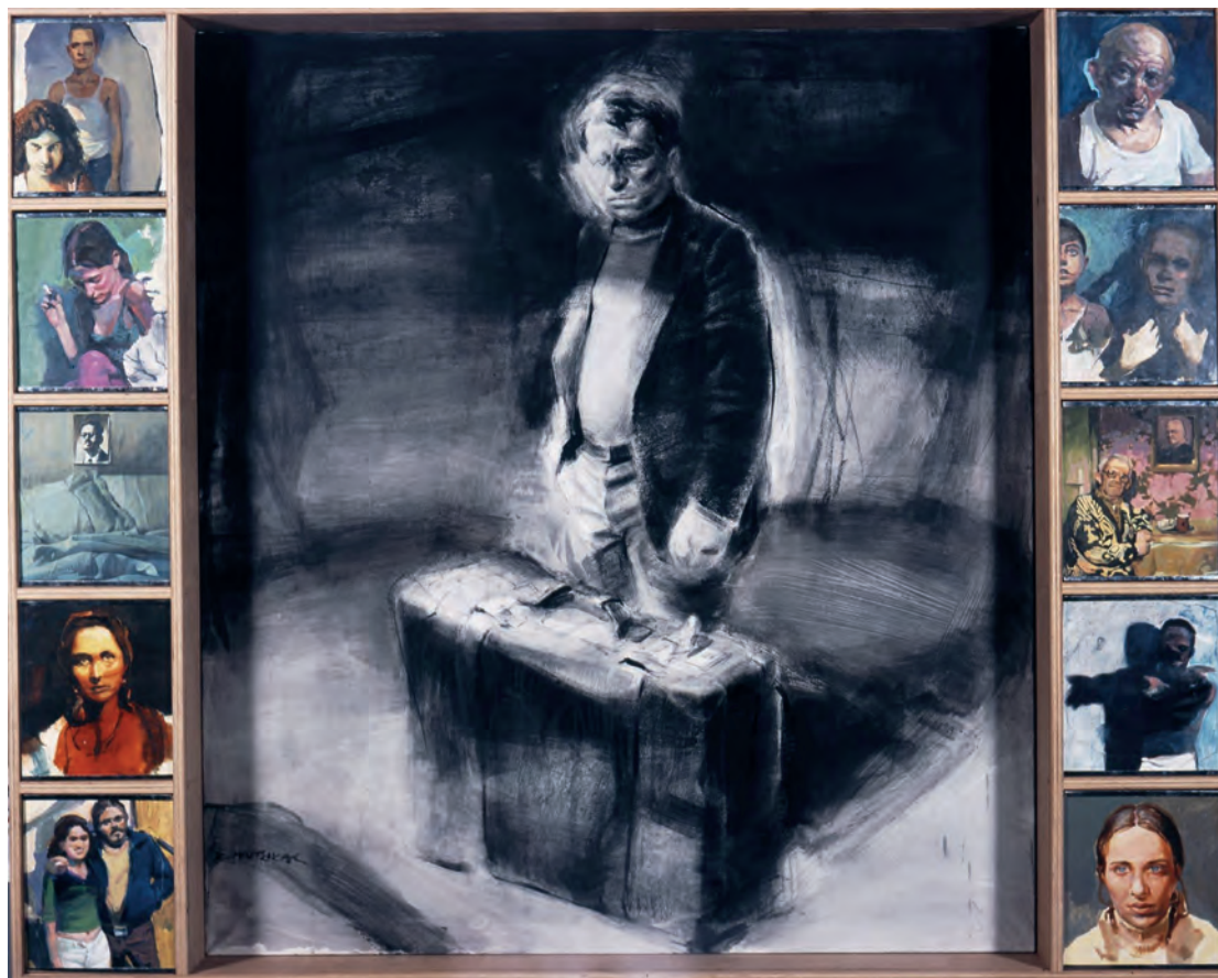
Μπήτσικας Ξενοφών, Ο Μετανάστης , 2002.