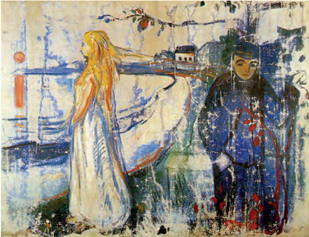
Έντβαρντ Μουνκ, Χωρισμός, 1894.