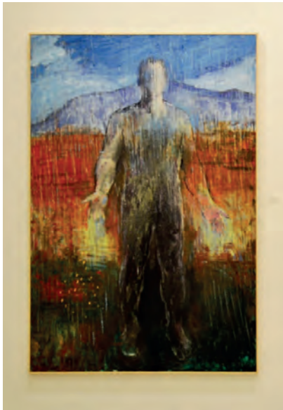
Μιχάλης Μαδένης, (χωρίς τίτλο), 2016.