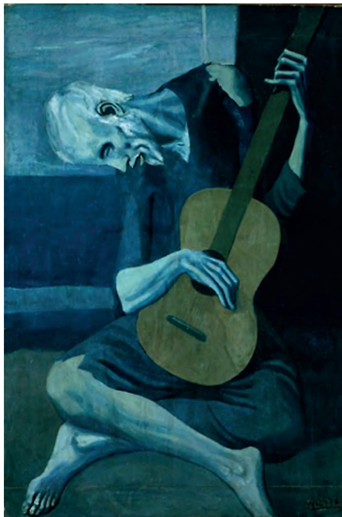
Πάμπλο Πικάσο, The old guitarist , 1903-1904.