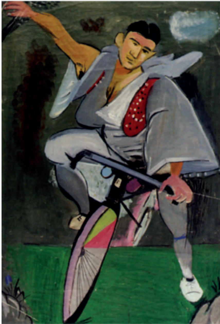
Γιάννης Τσαρούχης, Ποδηλάτης μεταμφιεσμένος σε τσολιά, μ' ένα νάο δεξιά κάτω, 1936.