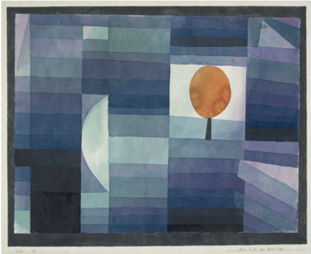
Πάουλ Κλέε, Ο αγγελιοφόρος του φθινοπώρου, 1922.