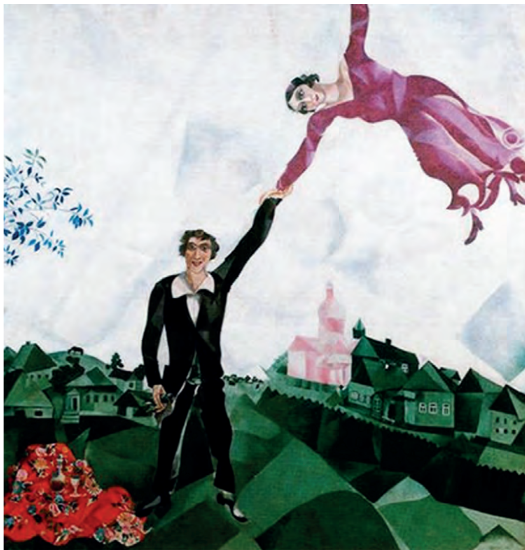
Μαρκ Σαγκάλ, Ο περίπατος, 1918.